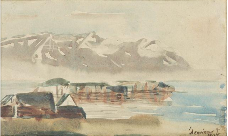
Ljósmynd af málverki eftir Ásgrím Jónsson, en málverkið verður sýnis á sýningunni “AÐ FLYTJA FJÖLL” í Listasafni Árnesinga í Hveragerði.