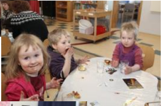
Nokkrar "Bolludagsmyndir" .Ljós: SigSigm