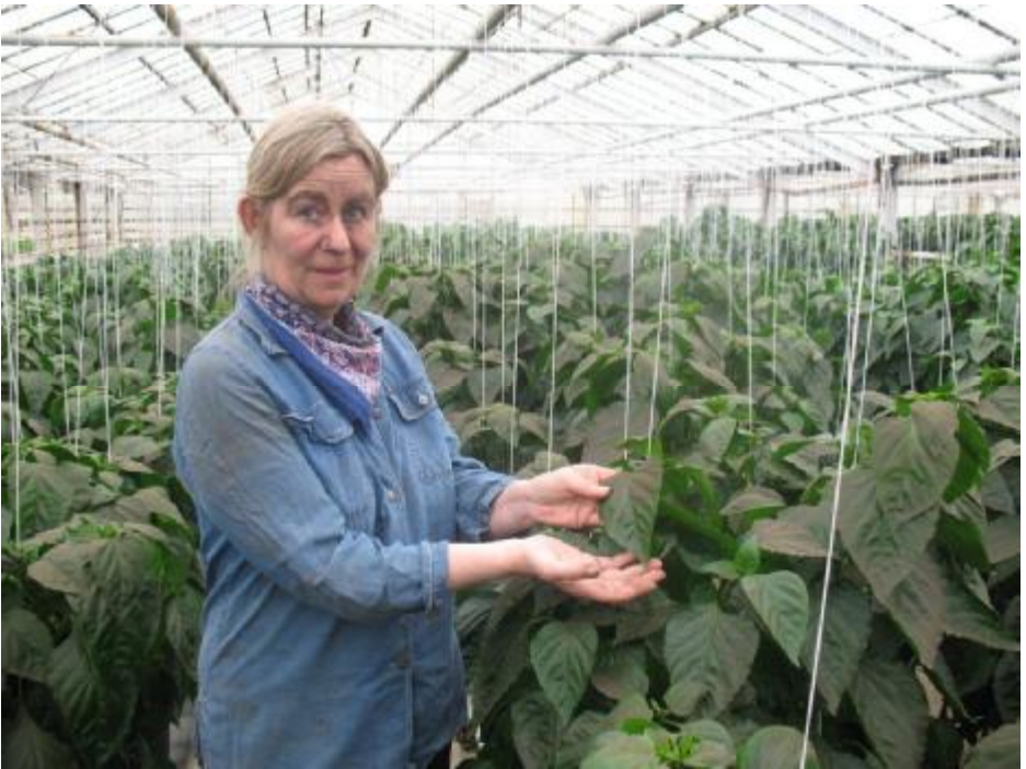
Aska úr Grímsvatnagosi á paprikuplöntunum á Reykjaflöt