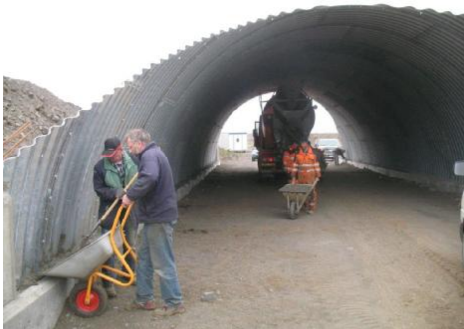
Verið að leggja lokahönd á frágang undirgangna við tjaldsvæðið á Flúðum