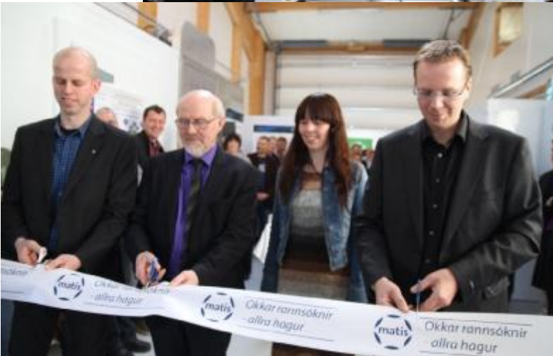
Frá opnun Matar- smiðjunnar á Flúðum..