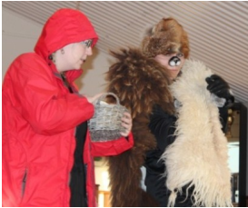
Rauðhetta og Úlfurinn ræða saman