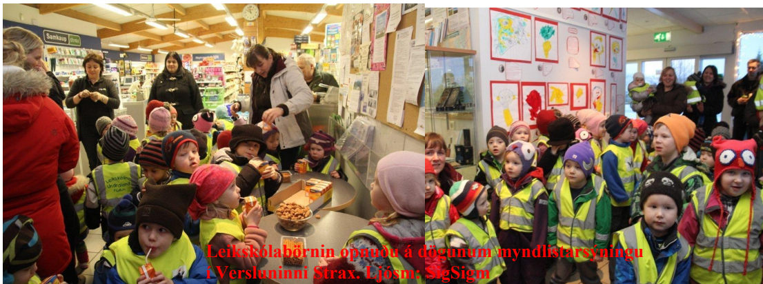
Leikskólabörnin opnuðu á dögnum myndlistarsýningu í Versluninni Strax.