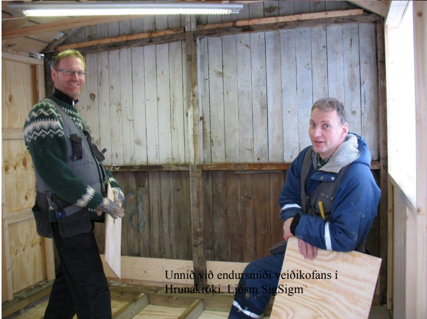
Unnið við endursmiði veiðikofans í Hrunakröki.