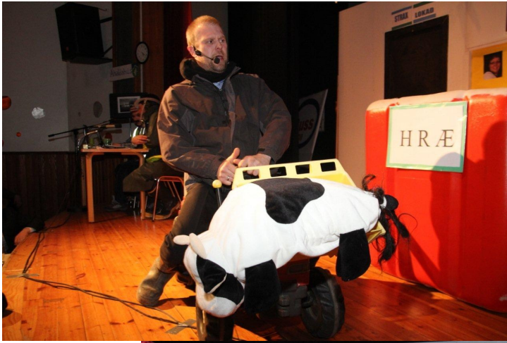
Hjónaball 2013.