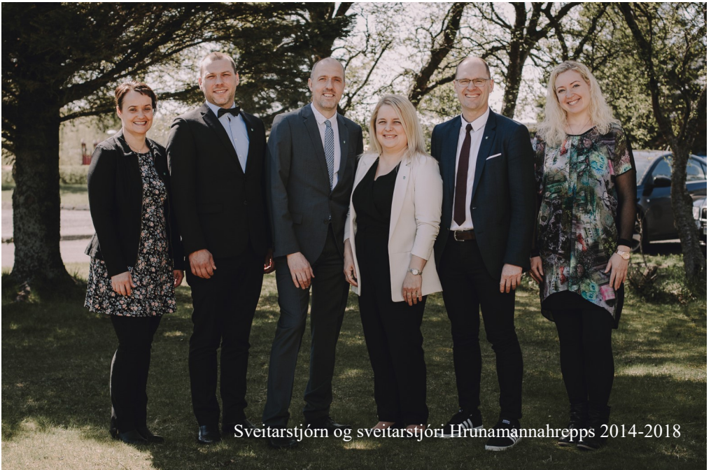
Sveitarstjórn og sveitarstjóri Hrunamannahrepps 2014-2018