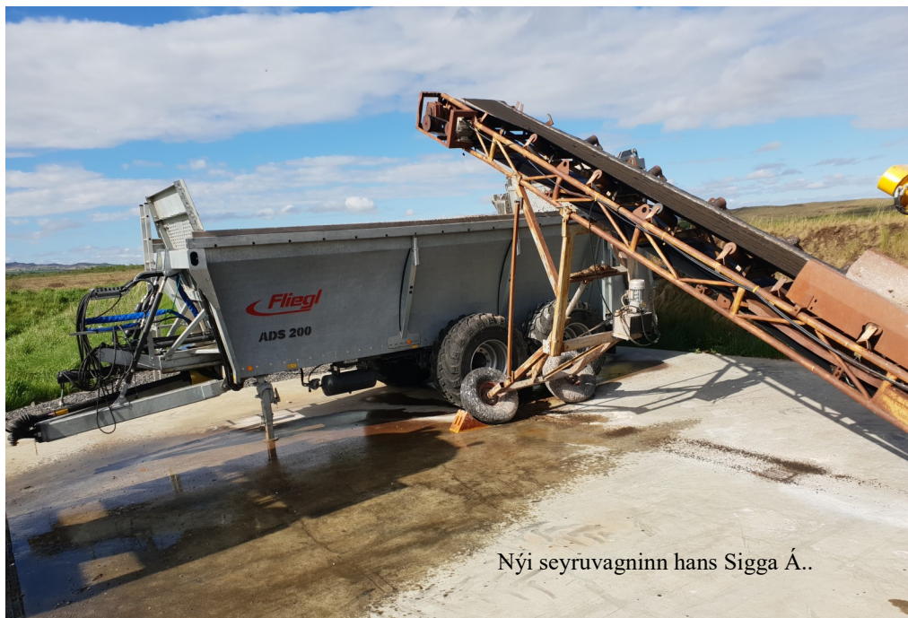
Nýi seyruvagninn hans Sigga Á..