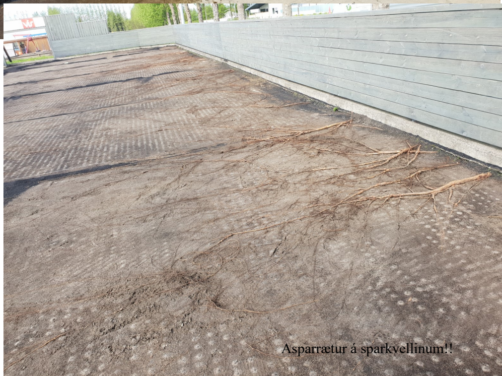
Asparrætur á sparkvellinum!!