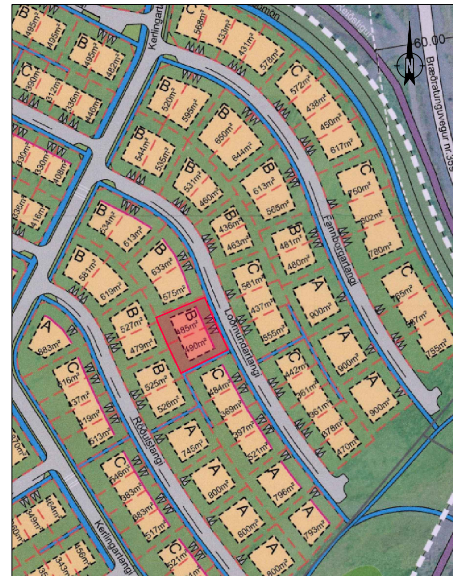
Yfirlitsmynd, ekki í mkv. Lóðin er sýnd í rauðu. Hluti af gildandi dsk.