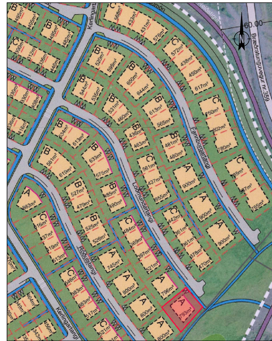
Yfirlitsmynd, ekki í mkv. Lóðin er sýnd í rauðu. Hluti af gildandi dsk.